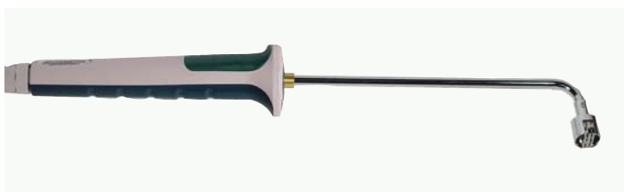
Термоэлемент для измерения температуры поверхности (контактным способом)

Изм. элемент: Термоэлемент NiCr-Ni класс 2 * Изм. наконечник: Рабочий диапазон -50...+500 °C Термальная лента, не эл. изолир. Изм. головка: диаметр 15 мм T 90 : * 1 сек. Кабель: 1.5 м ПВХ Подключение: миниатюрный плоский разъём L = общая приблизительно 180 мм, 90° изгиб, ~ 50 мм Артикул FTF104PH включая ручку и миниатюрный плоский разъём