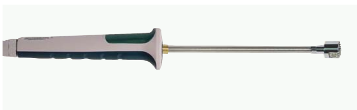
Термоэлемент для измерения температуры поверхности (контактным способом)

Изм. элемент: Термоэлемент NiCr-Ni класс 2 * Изм. наконечник: Рабочий диапазон -50...+500 °C Термальная лента, не эл. изолир. Изм. головка диаметр 15 мм T 90 : * 1 сек. Кабель: 1.5 м ПВХ Подключение: миниатюрный плоский разъём L = прибл. 180 мм Артикул FTF109PH включая ручку и миниатюрный плоский разъём